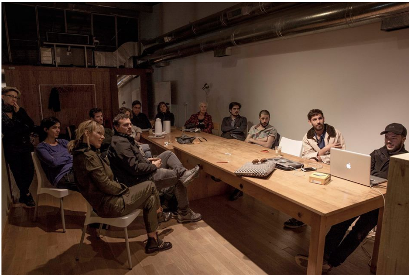
<La fotografía como metáfora> en Turma de Fotografía (CABA). Septiembre 2015