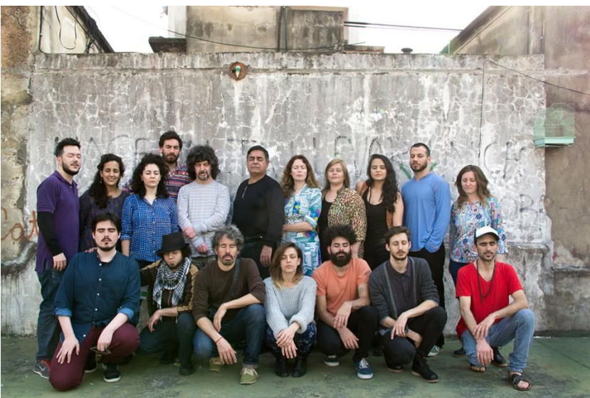
<La estética de lo feo> en SUB Cooperativa de Fotógrafos (CABA). Septiembre 2015