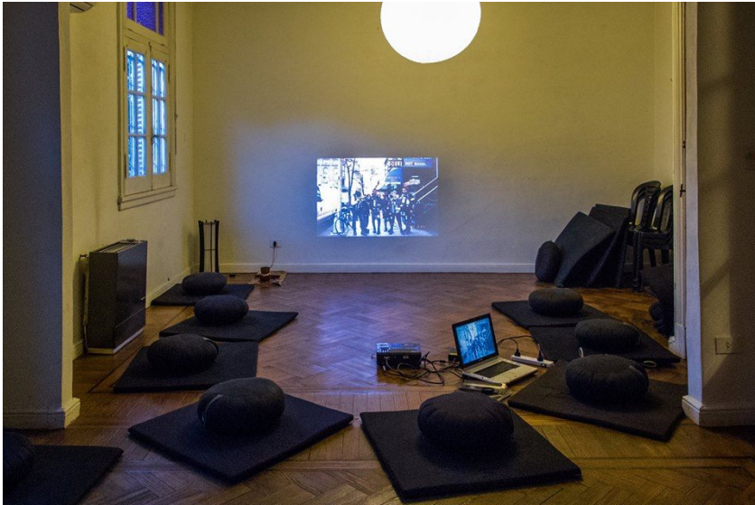
<Verdad o consecuencia. Cuerpo, fotografía y zen> en Zen Viento del Sur (CABA). Noviembre 2016