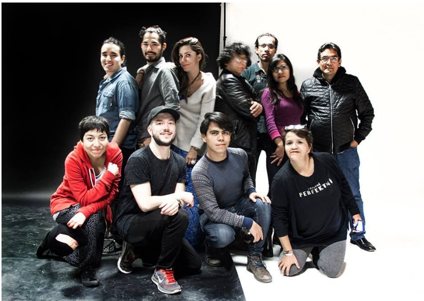
<El desnudo fotográfico> en Gimnasio de Arte y Cultura (Ciudad de México). Enero 2016