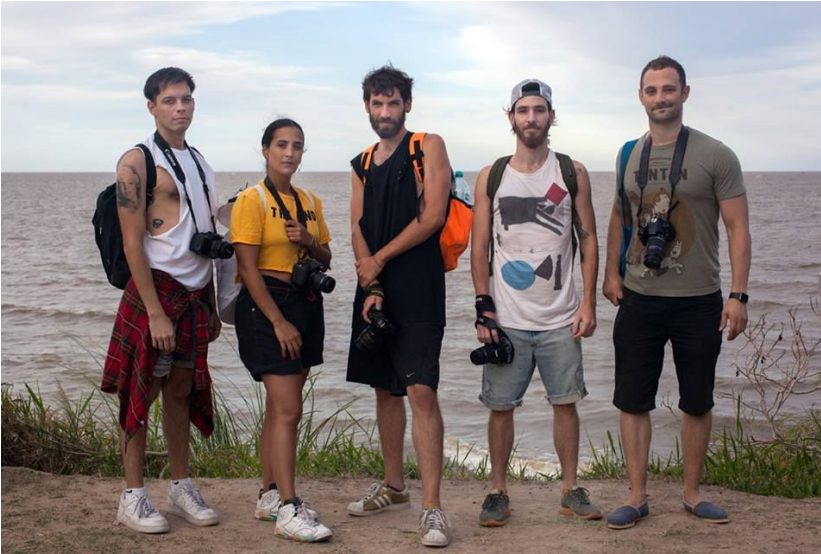
<Quisiera hacerte una foto> Marzo 2018.